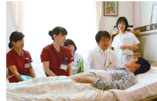
あなたの病室にチームが伺います

これらの活動を通して、緩和ケアセンターはこれからも地域で質の高い緩和ケアが提供していただけるように尽力してまいります。診断や治療時から、体の症状、不安・心配なことなど、何かお困りのことがありましたら、お気軽に患者家族相談支援センターまでお声かけください、緩和ケアセンターを中心に病院全体でサポートさせていただきます。