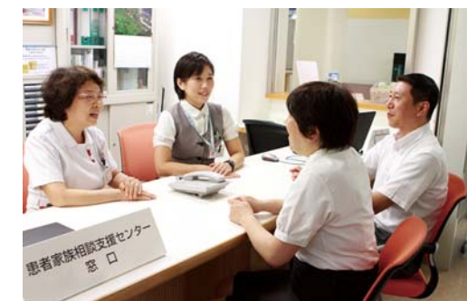
患者家族相談支援センターでは療養の場や方法のご相談もお受けします